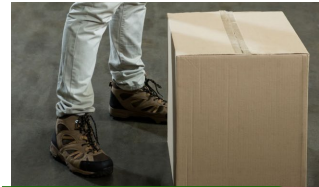
Levantamiento de objetos