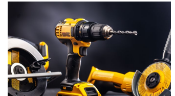
Manejo de herramientas.